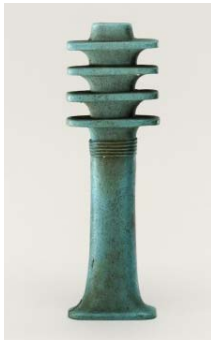
18. kép (EA12235)

A 17. képen látható példány a 18. dinasztia idejére datálható és III. Thotmesz nevei olvashatók a két oldalán. Szakkarában találták, egy Dzsehuti nevű férfi temetkezési mellékleteként.