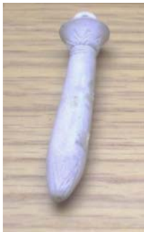
19. kép (56.134-E)

A 26. dinasztia korából maradt ránk ez a zöldeskék fajanszból készült dzsed-oszlop amulett. Ozirisz hátgerincével hozzák összefüggésbe, hieroglif jelként pedig tartósságot jelent. Már az Óbirodalomban megjelenik és az ókori egyiptomi történelem során végig előfordul ez az amulett. Bár a Halottak könyve 155. fejezete szerint aranyból kellett volna készíteni, gyakran zöld színű anyagból állították elő, mely a megújulásra utal.