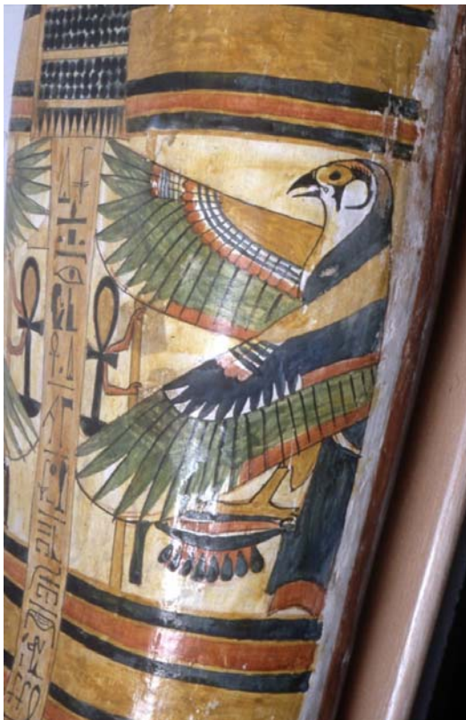
8. kép – Sólyom vagy kánya.