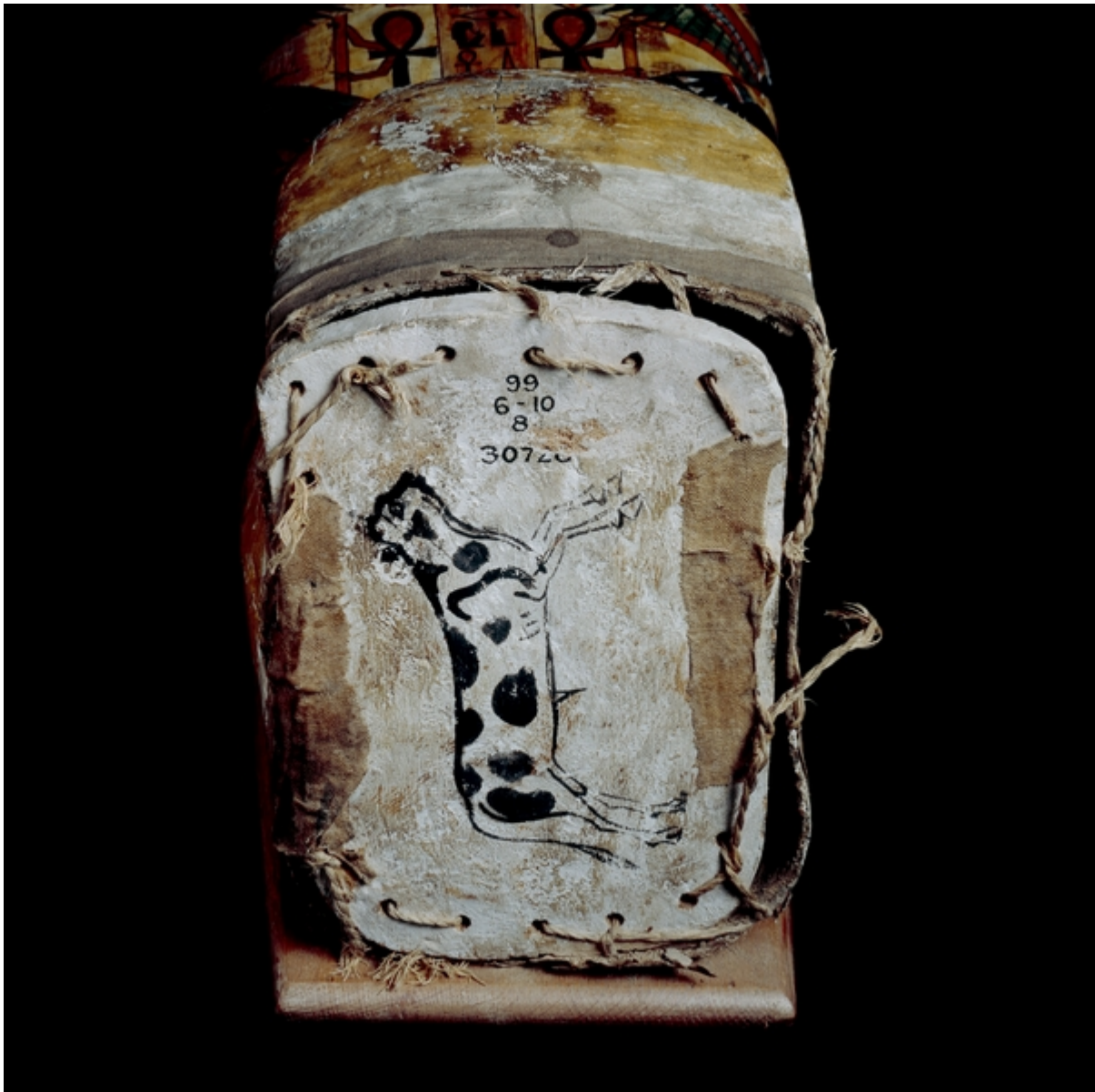
10. kép – A koporsó talprésze a bikával.