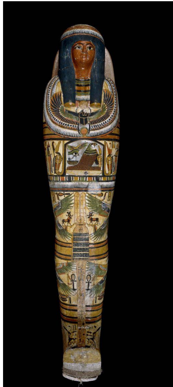
2. kép – A külső koporsó alsó fele. © BM 3. kép – A kartonázs koporsó © BM

Az istennő karjait kitarja, hogy védelmező ölelésébe vonja Neszperennubot.