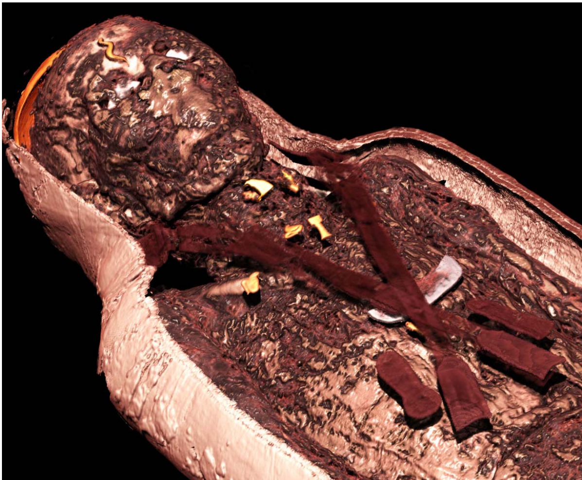
15. kép 9

A szív skarabeuszt általában sötétzöld vagy fekete kőből készítették, a Napisten egyik megjelenési formája és az újjászületés szimbóluma. Neszperennub kulcscsontja közelében valószínűleg egy ilyen látható. A mellkason egy fémlemezről készült kiterjesztett szárny látható. Közvetlenül ez alatt pedig egy papirusz-oszlop amulett.