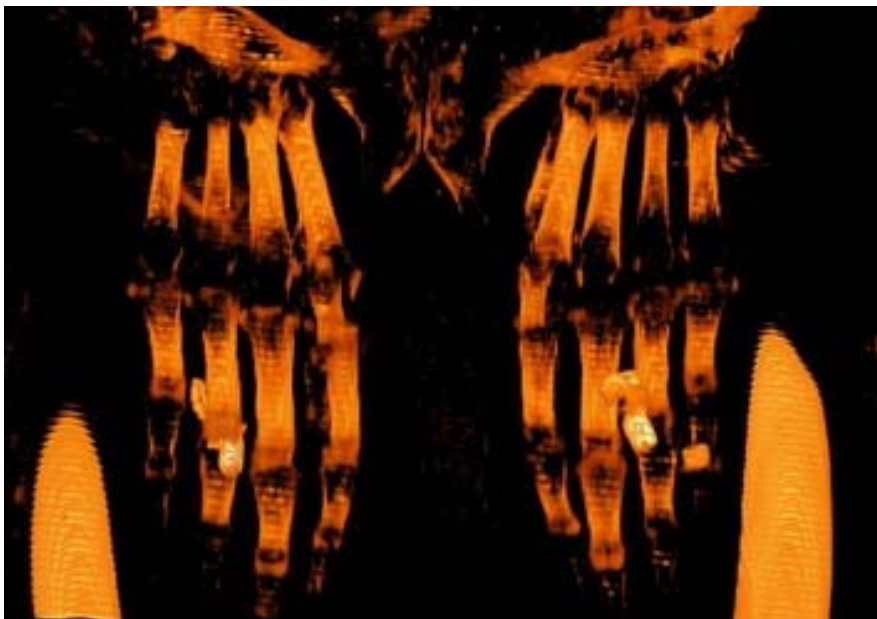
14. kép - Kezek

A szkener kimutatta, hogy a pap mindkét kezének gyűrűsujjain gyűrűket visel, ezeket valószínűleg fémből, nem lehetetlen, hogy aranyból készítették. Gyűrűket gyakran találnak múmiákon, Tutankhamon is számosat viselt mind a kezén, mind pedig a bandázsok közé csomagolva. Neszperennub feltehetőleg életében is hordott gyűrűket, de azok, amelyek halálában ékesítik, talán olyan ábrázolásokat és feliratokat tartalmaznak, amelyek túlvilági boldogulását segítik.