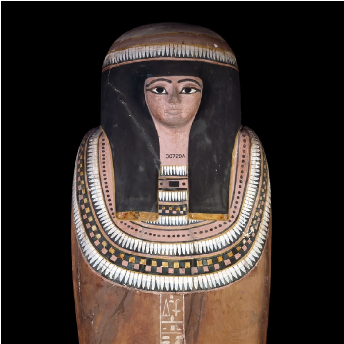
1. kép – A külső koporsó