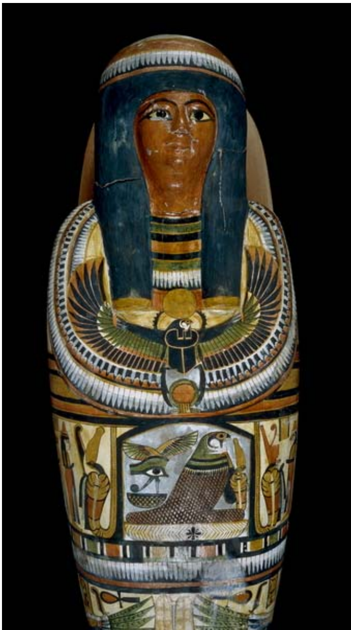
4. kép – A kartonázs koporsó részlete

Ezt úgy állították elő, hogy 20 réteg vásznat ragasztóba vagy gipszbe mártottak, egy eldobható múmiaformájú magra helyezték, mely valószínűleg sárból és szalmából volt megformázva. Amíg a vászonrétegek még képlékenyek voltak, hátul és a talp részénél felvágták és a magot eltávolították, majd behelyezték a múmiát. A vágást ezután zsineggel szorosan összeöltötték. Ez a fajta koporsó olcsóbb és könnyebben elkészíthető volt, mint a fa, vagy kő. Miután a múmiát a belsejébe zárták, többé nem lehetett eltávolítani róla, csak úgy, hogy ha eltörték. Ez megakadályozta azt, hogy a koporsót később az eredeti holttest eltávolításával más újrahasználja.