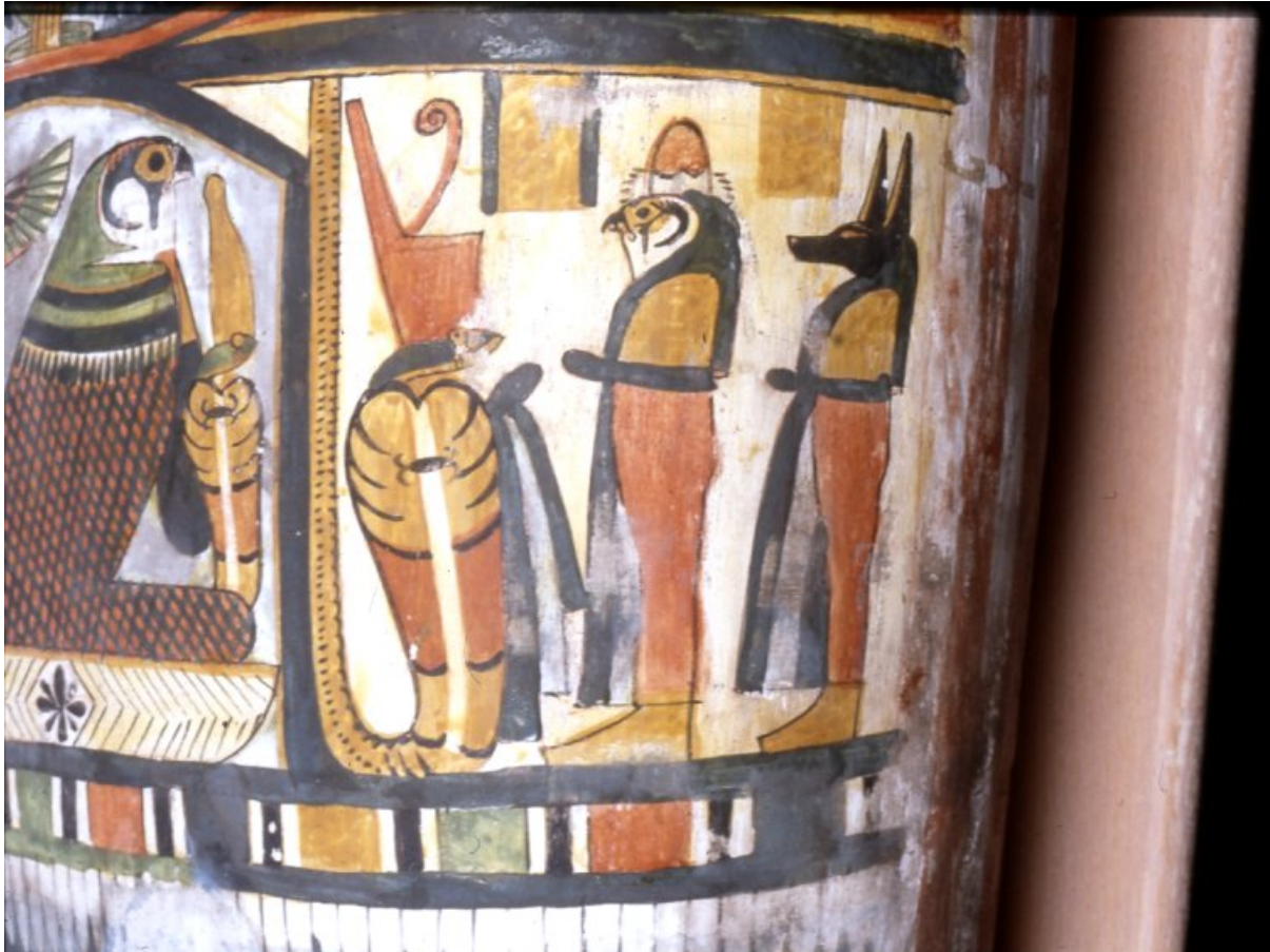
5. kép

Miután finom fehér gipszréteggel vonták be a kartonázs múmiatartót, befestették. Nézzük meg részleteiben, hogy milyen ábrázolások díszítik a pap kartonázs koporsóját. Az uzeht-galléron a Napisten látható sólyomfejű skarabeusz formájában, aki felül a napkorongot tartja, alul pedig a sen-gyűrűt, mely az örökkévalóság szimbóluma. Alatta egy szentélyben sólyomalakú isten látható Szokarisz-Ozirisz. Őt a szentélyen kívül két kobra őrzi, Egyiptom védőistennői Nekhbet és Uadzset. Az egyik Felső-Egyiptom fehér koronáját, míg a másik Alsó-Egyiptom vörös koronáját viseli a fején.