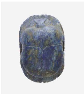
20. kép © The Metropolitan Museum of Art (22.3.64)

A Szépművészeti Múzeum gyűjteményében őrzik ezt a fajansz papyrusz-oszlop amulettet, mely a Későkorból származik. Az Újbirodalomtól válik gyakorivá, de már a Koporsó szövegekben említik. A Halottak könyve 159-160. fejezete szerint zöld földspátból kellett készíteni, az elhunyt épségét, egészségét őrzi meg.