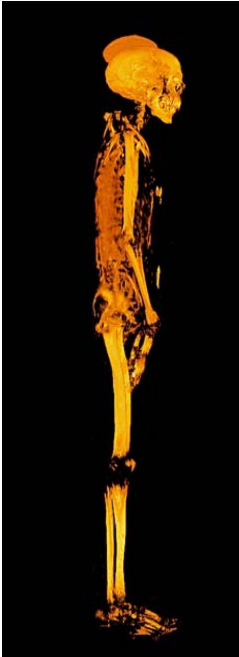
11. kép – A csontváz

A fa koporsóban, azon belül a kartonázs tartóban, vásznakkal betekerve fekszik Neszperennub teste. A hagyományos balzsamozási eljárásban részesült. Először eltávolították az agyát az orrán keresztül egy fém rúd segítségével. A 3D felvételeken látszik egy vékony, papírszerű anyag a koponya belsejében, ez szinte biztosan az agyat körülvevő hártya maradványa.