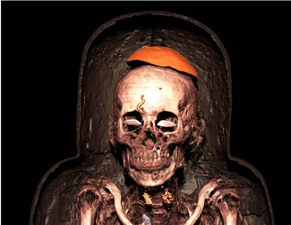
16. kép 10

A pap jobb szeme felett is látható egy apró, dzsé hieroglifát formázó kígyó amulett. A röntgenképen nem jelenik meg, csak a 3D felvételeken, ez arra utal, hogy viszonylag kis sűrűségű anyagból, például méhviaszból készült. Az ilyen kígyót mintázó amulettek ritkák, de egy aranyból formázott példányt találtak Hornakht herceg szarkofágjában Taniszban (kb. i. e. 850), illetve egy Leidenben őrzött későkori múmia jobb szeme felett is kimutatott a röntgen egy ilyen amulettet.