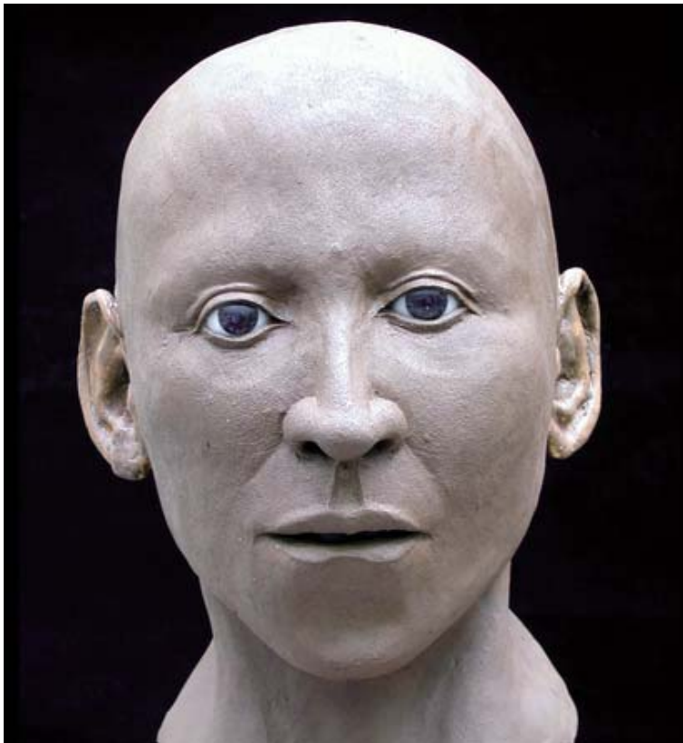
22. kép – Neszperennub

A koporsók feliratai szerint ő és az apja Thébában, Amon-Ré templomában dolgozott, tevékenységük azon belül Honszuzhoz kapcsolódott. A Honszu templom tetőteraszán található feliratok egyéb címeit is megőrkítik: „Legyezőhordozó Honszu jobb kezénél, legyezőhordozó a király jobb kezénél.” A listában felsorolják őseit is, ez arra utal, hogy magas rangú ember volt, egy befolyásos család tagja.