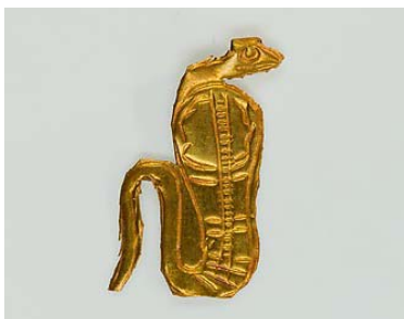
21. kép (25.3.167)

Thébában került elő ez a lazúrkőből faragott szív-skarabeusz, mely mágikusan hallgatásra kötelezte az elhunyt szívet a mérlegelésnél, ugyanakkor védelmezte az elhunyt szívet és helyettesítőjeként szolgált, arra az esetre, ha az eredeti szerv megsemmisül. Ennek a hátoldalán nincsen felirat, de gyakran a Halottak könyve 30b fejezete szerepel rajtuk. Ez a példány a 26. dinasztia korára datálható.