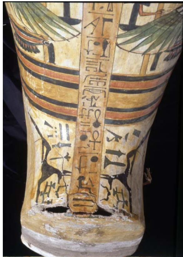
9. kép – Upautok