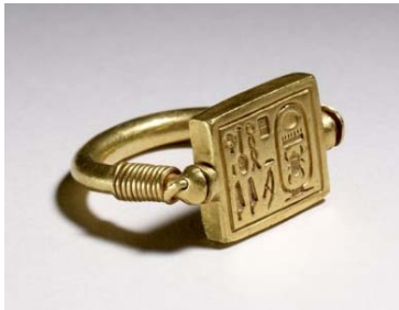
17. kép © BM (EA71492)

Ez az aranygyűrű hasonlít a Neszperennub bal gyűrűsujján (a 14. képen, jobb oldalon) lévőhöz, de elképzelhető, hogy a papén a forgatható lemez féldrágakőből készült.