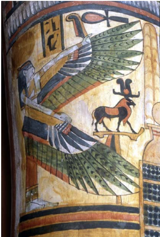
6. kép Ízisz istennő

A talprészre az Ápisz bikát festették, akinek egyik feladata az volt, hogy elvigye a halottat a sírba.