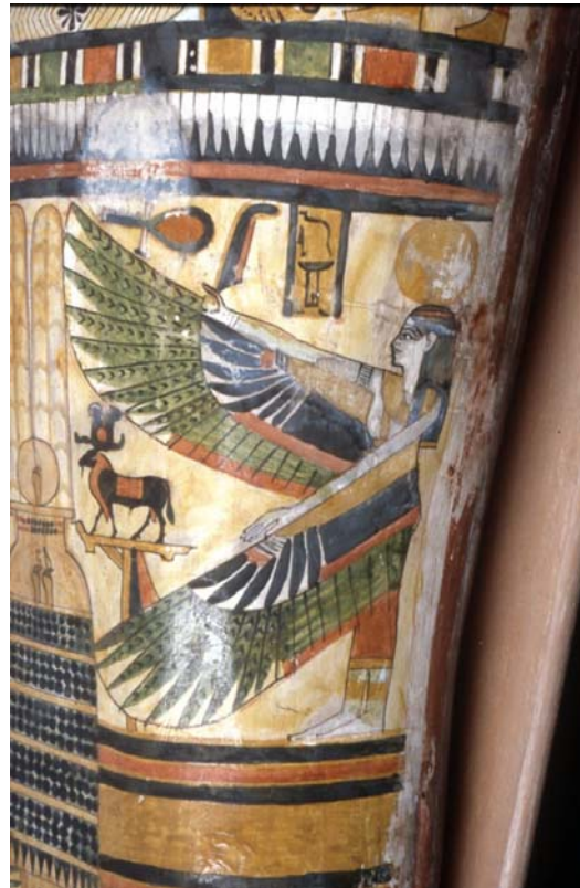
7. kép - Nephthüsz istennő