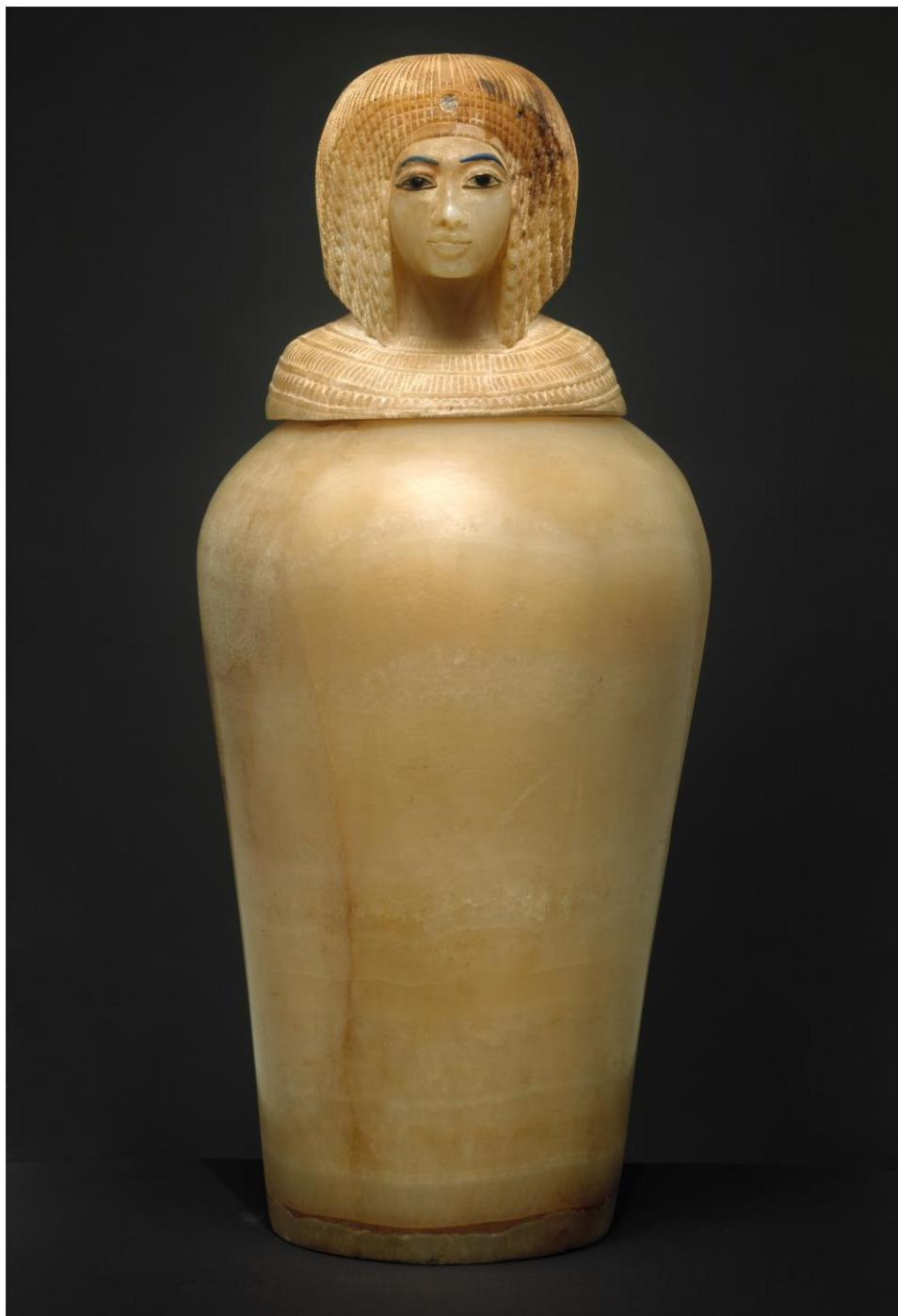
5. kép A Metropolitan Múzeumban őrzött kanópusz-edény.

nevemet folyamatosan, anélkül, hogy keresni kelljen a szádon. Uram Ekhnaton, légy itt örökkön örökké, élj, mint az élő korong.” 5