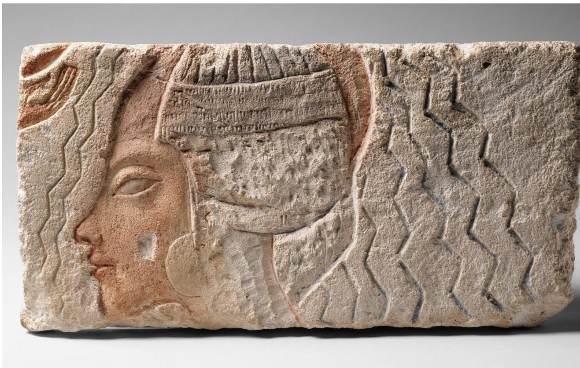
7. kép – Egy a Metropolitan Múzeumban őrzött relief Kiyáról