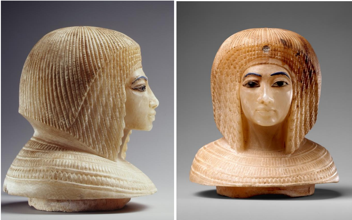
3-4. kép – A Metropolitan Múzeumban őrzött kanópusz-edény fedele.

tagjai viselték. 1907-es megtalálása óta a fejet több királynővel is azonosították, mint Teje, Nefertiti és Kiya vagy Ekhnaton legidősebb leánya Meritaton, sőt még az is felmerült, hogy magát Ekhnatont ábrázolja.