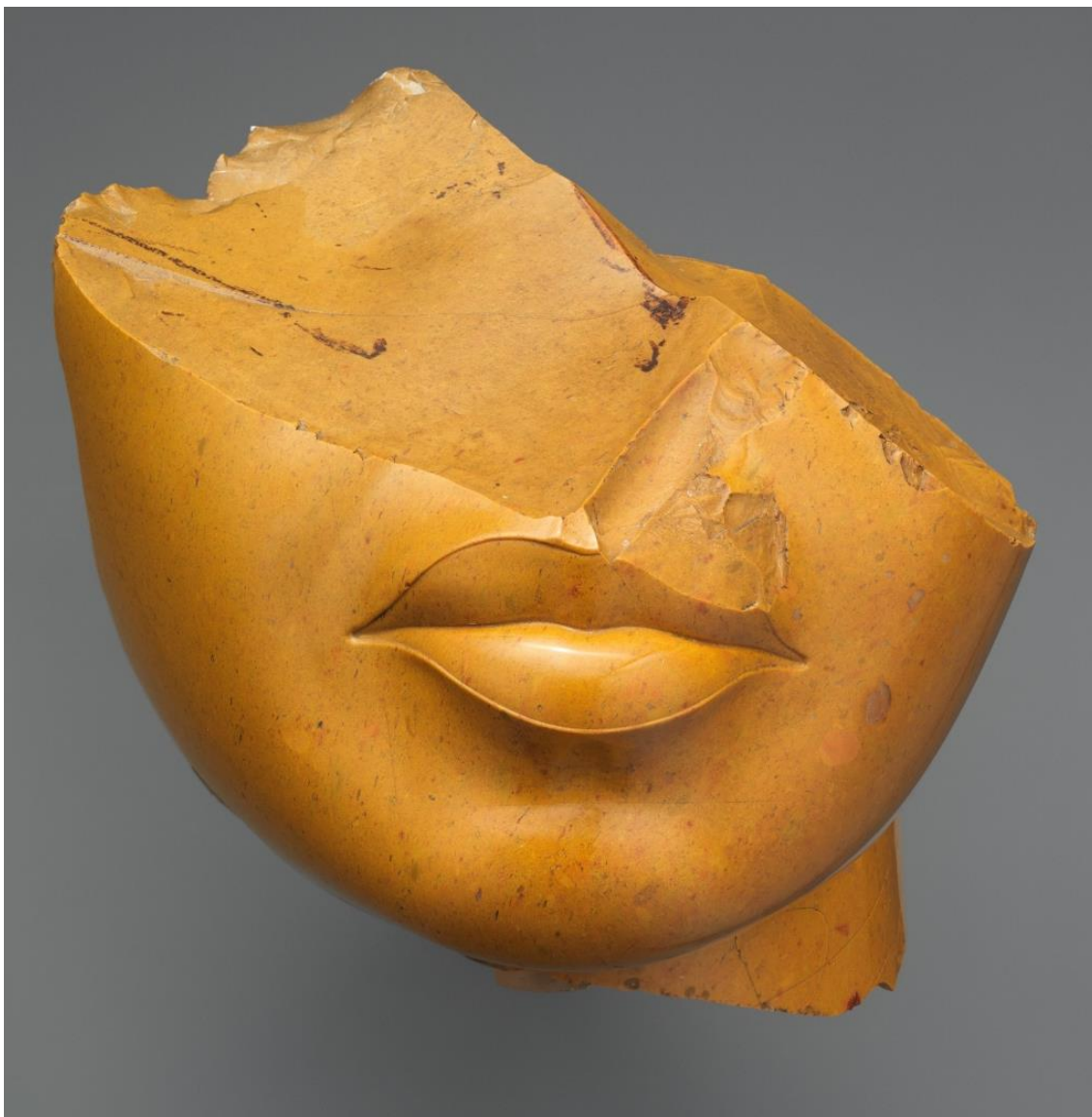
9. kép – Királyné szobrának töredéke sárga jáspisból faragva.

Még egy tárgyat meg kell említenem a királynével kapcsolatban. Dorothea Arnold a „The Royal Woman of Amarna” című könyvében elképzelhetőnek tartja, hogy őt ábrázolja egy a Metropolitan Múzeumban őrzött sárga jáspis szobortöredék, mely a 9. képen látható. Érdekessége, hogy a szobor eredetileg több kőből állt, mivel a nyakon egyiptomi alabástrom nyoma figyelhető meg, melyből egykor valószínűleg a nőalak fehér ruháját faragták ki.